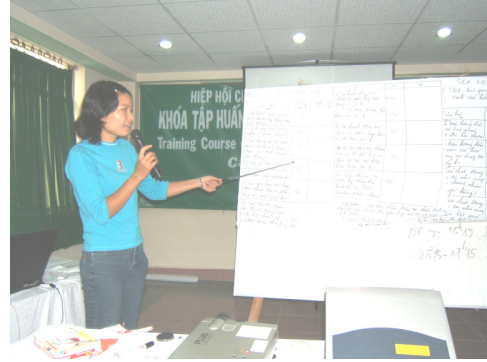
Học viên thuyết trình bài tập nhóm