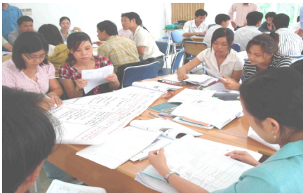
Làm bài tập nhóm