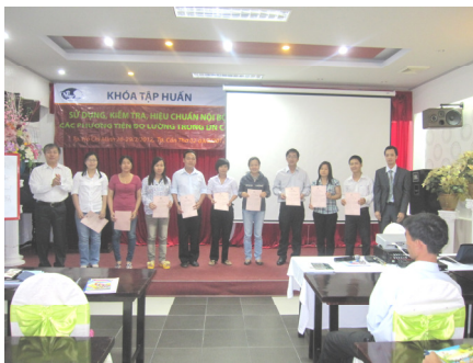
Nhận Giấy khen – Chứng chỉ sau khóa học