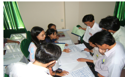
Cùng nhau trao đổi – thảo luận