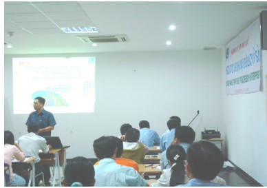
Nghe giảng – xem film